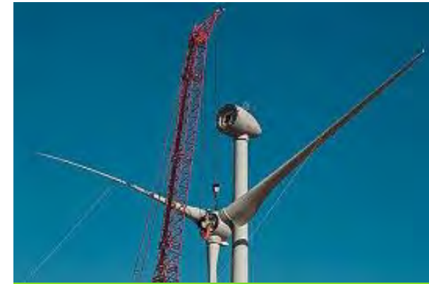
Construction & Repowering