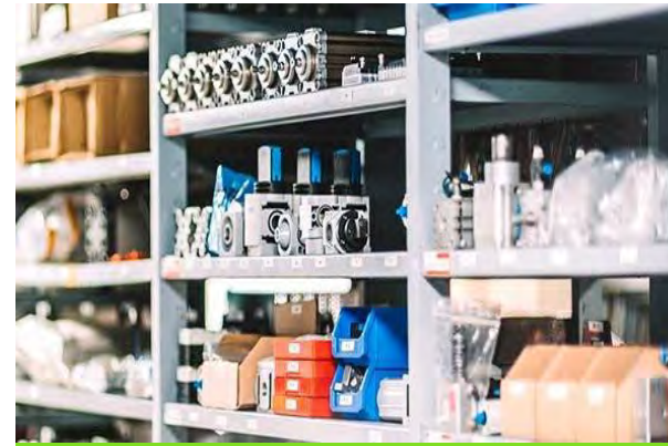
Gestion des composants