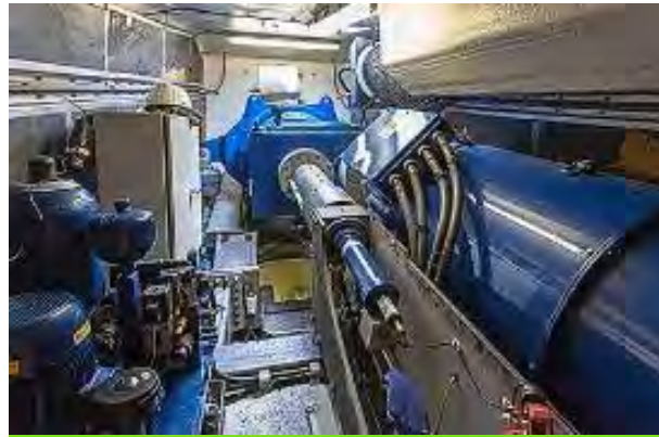
Maintenance de parcs